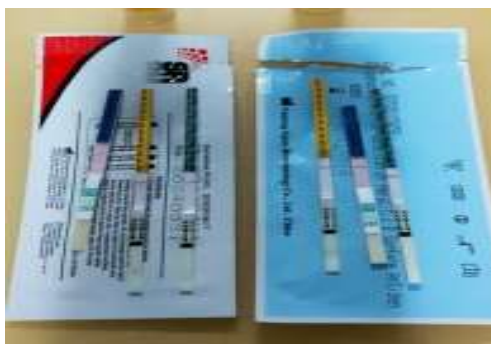
Gambar 4.1 Gambar Hasil Skrining Anti-HCV

Pada tabel 4.2 , dari kode sampel 1-10 menunjukkan hasil negatif, yang menandakan bahwa tidak terdeteksi adanya antibodi HCV pada sampel. Dari seluruh sampel, tidak terdapat hasil positif, yang menandakan adanya antibodi HCV dalam sampel pasien. Ini dapat dilihat secara jelas dalam bentuk gambar yaitu pada gambar 4.1 .