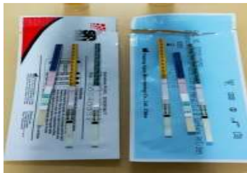
Gambar 4.1 Gambar Hasil Skrining Anti-HCV

Pada tabel 4.2 , dari kode sampel 1-10 menunjukkan hasil negatif, yang menandakan bahwa tidak terdeteksi adanya antibodi HCV pada sampel. Dari seluruh sampel, tidak terdapat hasil positif, yang menandakan adanya antibodi HCV dalam sampel pasien. Ini dapat dilihat secara jelas dalam bentuk gambar yaitu pada gambar 4.1 .