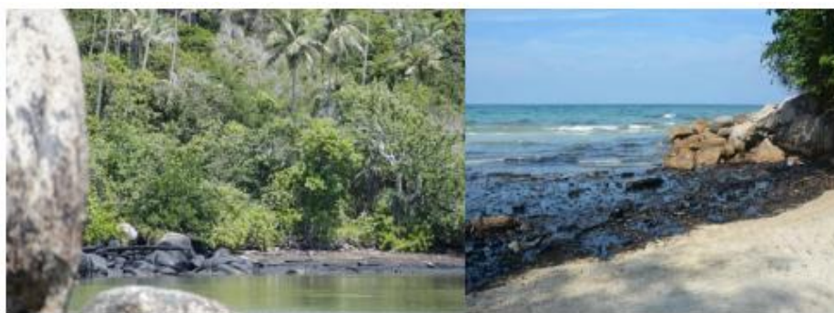
Gambar 4. Dampak dari Polusi

MARPOL 73/78 menetapkan batasan untuk pembuangan yang diperbolehkan bagi kapal, di mana kadar emisi ke dalam air tidak boleh lebih dari 15 ppm (parts per million). Apabila minyak tampak di permukaan lautan, itu menunjukkan adanya pembuangan minyak yang melebihi batas 15 ppm; ini berarti telah terjadi pelanggaran yang membutuhkan penyelidikan segera. Limbah minyak dari kargo dapat dibuang jika kapal tanker berada lebih dari 50 mil laut dari pantai terdekat, menurut Peraturan 34 MARPOL 73/78, dan ada larangan pembuangan minyak di daerah-daerah tertentu. Setiap jejak minyak yang muncul di laut atau di sekitar kapal mencerminkan adanya pelanggaran yang perlu diteliti. Sumber pencemaran berasal dari sisi timur perairan 3 Negara Pesisir, yaitu area paling timur Selat Singapura.