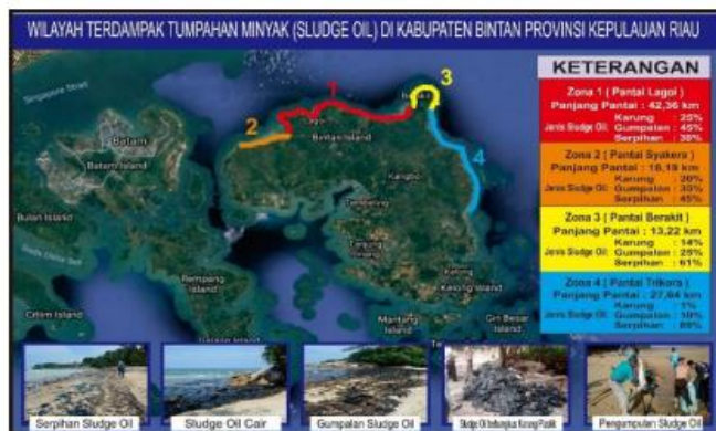
Gambar 1. Wilayah Terdampak

Sumber : The area affected by sludge oil (source: Dinas Lingkungan Hidup Bintan Regency Indonesia)