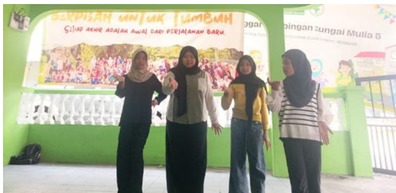
Gambar 3.1. Tahap Latihan Meniru gerakan yang di ajarkan pendamping