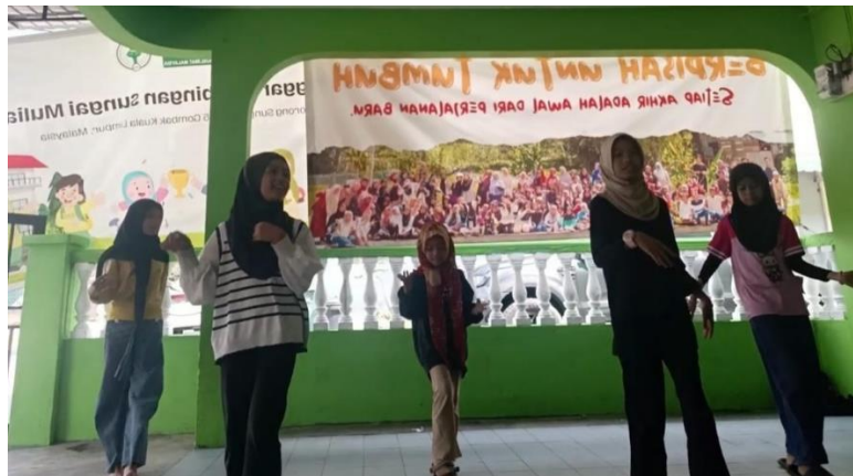
Gambar 3.2. Tahap Latihan Meniru Gerakan Vidio Youtube.