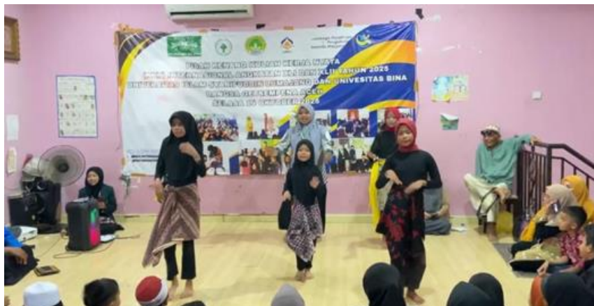
Gambar 3.3. Tahap Pementasan dalam Acara Perpisahan KKN

Dari hasil pendampingan, diperoleh sejumlah temuan penting: