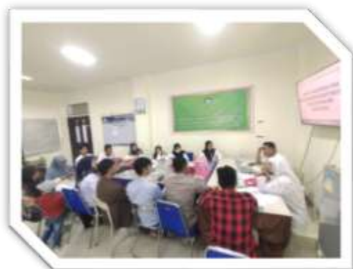
Gambar 1. Perencanaan kegiatan PKM

Metode pelaksanaan kegiatan pengabdian ini menggunakan metode berbentuk pendampingan dan demonstrasi (praktek) melalui tahapan sebagai berikut: