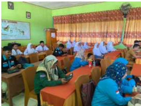
Gambar 6. Peserta Menerima Bahan Pendampingan

Sesuai dengan kriteria keberhasilan program PK, maka kegiatan ini dinilai berhasil apabila mampu meningkatkan pengetahuan dan wawasan peserta kegiatan. Berdasarkan hasil evaluasi tindak lanjut dalam manfaat praktis yang diperoleh peserta pelatihan berbasis IT yaitu mendapatkan informasi yang jelas dan utuh mengenai cara melakukan pembelajaran secara efektif dan efisien.