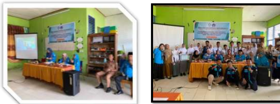
Gambar 2. Pelaksanaan kegiatan PKM

Untuk melihat keberhasilan pelaksanaan kegiatan perlu diadakan evaluasi. Evaluasi yang dilaksanakan dalam kegiatan ini adalah sebagai berikut: