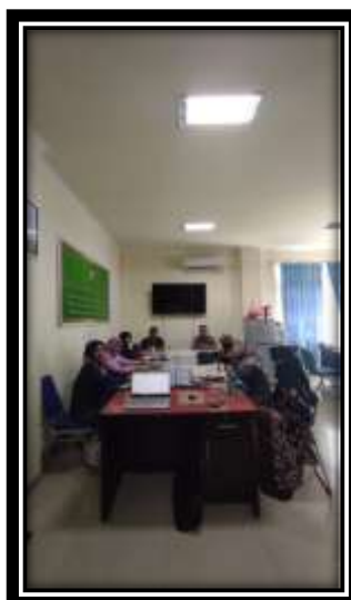
Gambar 3. Evaluasi kegiatan PKM