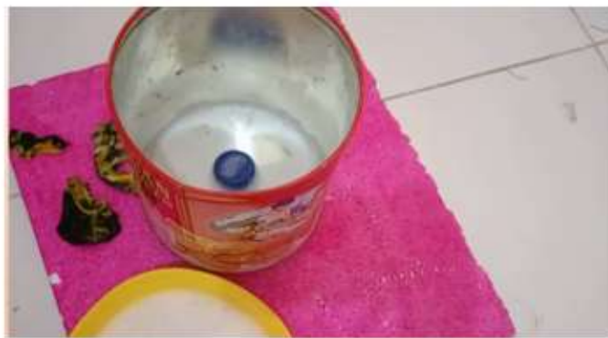
Gambar 1. Alat mesin cuci mini

volt yang berukuran kecil hasil pada putaran mesin cuci untuk ukuran baju yang besar tidak bisa bekerja dengan baik, kekuatan airnya lebih lambat. Dimana ketika menggunakan baterai 12 volt putaran untuk dinamonya juga lebih lambat. Namun ketika menggunakan dinamo 12 volt, maka akan ada pengaruh pada arah putaran yaitu adanya reaksi putaran pada mencuci baju sebagai hasil dari eksperimen tersebut.