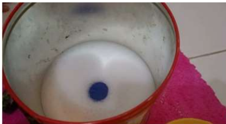
Gambar 2. Hasil dari putaran mesin cuci menunjukkan gaya tangensial

Pada gambar di atas menjelaskan bahwa Ketika mesin cuci berputar, baju di dalamnya terpengaruh oleh gaya-gaya tangensial dan sentripetal. Gaya sentripetal bekerja menuju pusat mesin cuci, menjaga baju tetap berputar mengikuti lintasan melingkar. Sementara itu, gaya tangensial bertanggung jawab untuk mendorong baju ke arah sepanjang lintasan melingkar tersebut. Kombinasi antara kedua gaya ini menyebabkan baju bergerak secara melingkar sambil tetap tertarik ke pusat mesin cuci. Akibatnya, baju bergerak dengan pola yang teratur dan berulang selama siklus pencucian. Ini adalah alasan mengapa baju dalam mesin cuci tampak bergerak secara berputar, karena gaya-gaya ini berinteraksi satu sama lain untuk menciptakan gerakan tersebut.